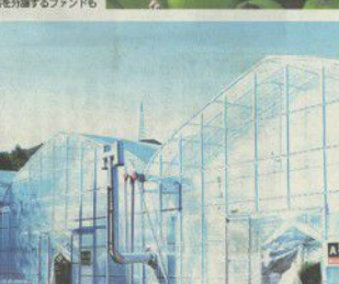
オアシスビルやホテルに加え、テーマパーク「伊弉諾神社」などの観光利便性を提供するランドも

みんなが大好きなバナナ。実はバナナは果物の王様と呼ばれてきた。バナナは果物の王様と呼ばれてきた。バナナは果物の王様と呼ばれてきた。バナナは果物の王様と呼ばれてきた。